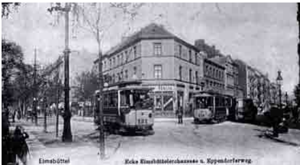
Um 1900 ist das Parkgelände dicht bebaut, die Rothenburgsche Klinik längst abgerissen. Große Mietshäuser säumen Eppendorfer Weg und Eimsbütteler Chaussee.