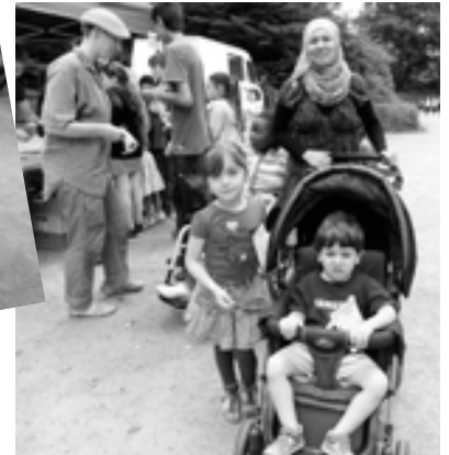
Ob Rollstuhl oder Kinderkarre: Dabei sein war alles.