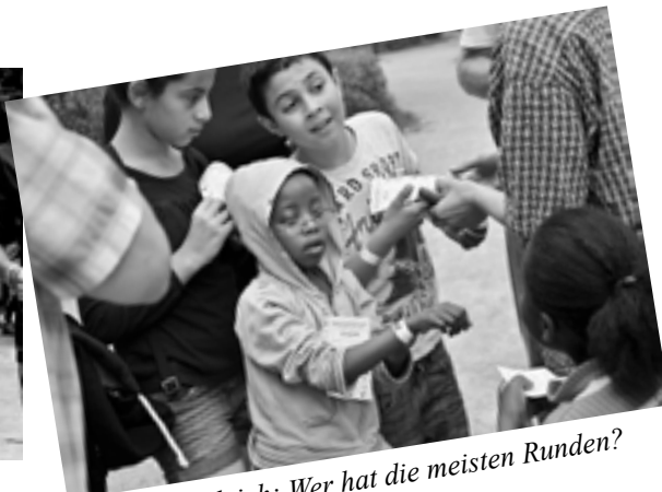
Großer Vergleich: Wer hat die meisten Runden?