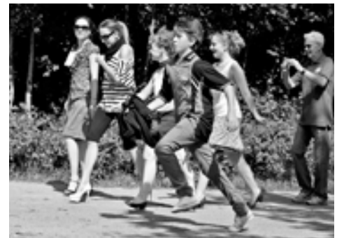
Stöckelschuhlauf: Immerhin 4 Damen trauten sich.