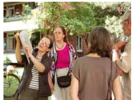
Stadtspaziergang durch „Neu-Eimsbüttel“, 2014, Foto: Andrea Orth