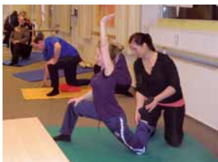
Dehnen und Entspannen - das Geheimnis der myofaszialen Fitness