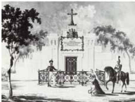
Abb. li.: Dem 1845 für den Altonaer Oberpräsidenten Graf Blücher ausgemauertem Hügelgrab mit seiner spätklassizistischen Sandsteinportalwand fügte man bereits vor 1847 an beiden Seiten abgetreppte Wände aus Sandsteinquadern an. Es handelt sich um die kunsthistorisch bedeutendste Grabanlage auf dem Friedhof. (Grabmal des Grafen Blücher-Altona, nach einem kolorierten Stich von C. Sell, 1847).

Es handelt sich bei ihr nicht etwa um den alten Kirchhof von St. Johannis - der ehemalige Friedhof Norderreihe, so der alte Name des Wohlersparks, ist Jahrzehnte älter als die erst zwischen 1868 und 1873 als Altonaer Stadterweiterungskirche erbaute St. Johanniskirche. Die Geschichte des Friedhofs reicht bis in die 1. Hälfte des 19. Jahrhunderts zurück. Bereits 1831 wurde er als neuer evangelischer Zentralfriedhof Altonas eingeweiht – also noch zu dänischer Zeit. Bis 1864 gehörte Altona, wie weite Teile Schleswig-Holsteins, zum dänischen Gesamtstaat, später dann zu Preußen. Erst 1937 wurde die Stadt nach Hamburg eingemeindet. An die dänische Zeit Altonas erinnern viele der bis heute im Wohlerspark erhaltenen Denkmale und Grabstätten. Das Hügelgrab des Altonaer Oberpräsidenten Conrad Daniel Graf von Blücher ist die größte und bedeutendste unter ihnen.