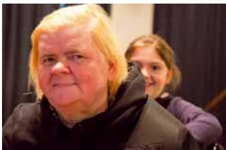
Immer ein Kind und ein alter Mensch bilden ein Team. Das klappt prima.

Geht das überhaupt? Theater spielen mit Menschen, die sich keine Texte merken können? Die oft nicht wissen, wo sie sind? Und wie ist das für die Kinder, wenn die Senioren sie beim nächsten Treffen nicht mehr erkennen? Kann man da überhaupt ein Stück entwickeln? Ja, man kann. „Kinder haben viel weniger Berührungängste im Umgang mit Demenz als Erwachsene“