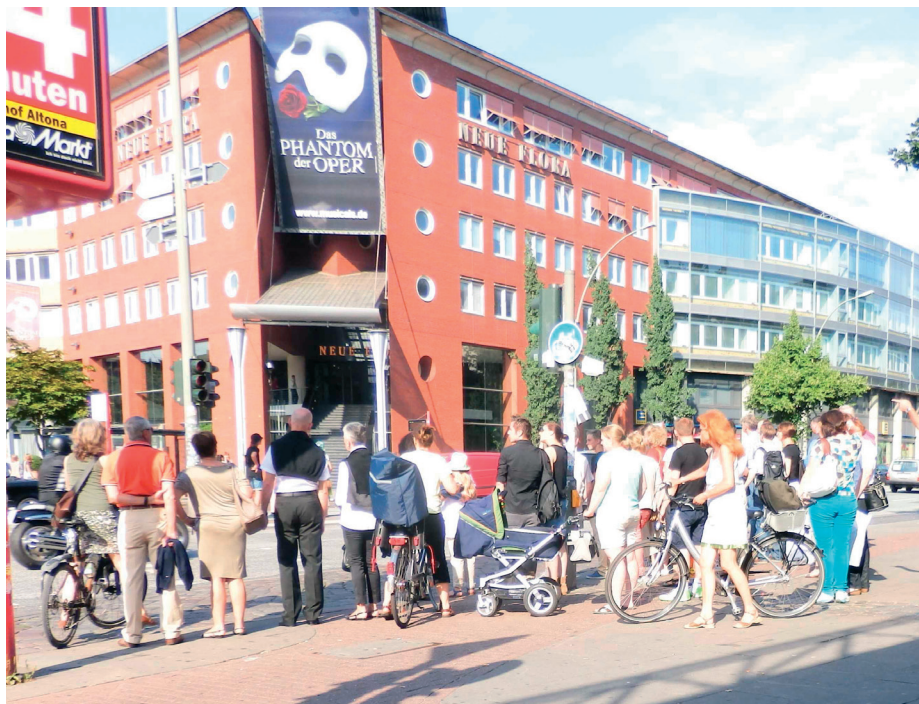
Eine Situation, die jeder kennt: An der großen Kreuzung Stresemannstraße/Alsenstraße kommen sich Fahrradfahrer und Fußgänger regelmäßig ins Gehege.

Wer mitmachen möchte, wende sich bitte an Horst Domnick, Email: horst-domnick@t-online.de