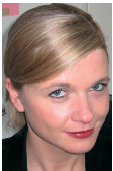
Franziska Grunwaldt, CDU

In der vergangenen Legislaturperiode eine Soziale Erhaltungsverordnung für Altona-Nord auf den Weg gebracht und befürwortet mit Nachdruck, dass diese auch bald Realität wird. Insbesondere die Umwandlung von Miet- in Eigentumswohnungen wird damit deutlich eingedämmt.