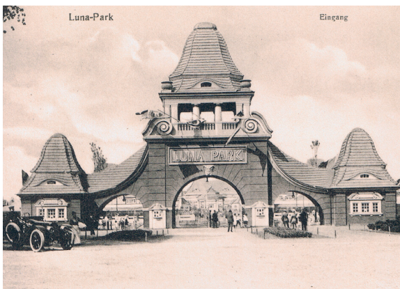
Das Eingangstor zum Lunapark - von allen Seiten strömten die Massen hier am 14. 9. zusammen.

Eine ganz besondere Veranstaltung war das Ziel der Massen. Der 1899 gegründete „Konsum-, Bau- und Sparverein Produktion“ und die von ihr seit 1911 formalrechtlich getrennte „Handelsgesellschaft Produktion“ hatten zu ihrem ersten Volksfest aufgerufen. Anlass war die bevorstehende Eröffnung der 100. Verkaufsstelle im Großbereich Altona-Hamburg-Wandsbek. Vier Läden der „Pro“, wie die genossenschaftliche Verbraucherorganisation im Volksmund bald kurz und anerkennend hieß, gab es damals schon in Altona-Nord und ihre Mitgliederzahl war von knapp 3.000 Ende des Gründungsjahres auf mittlerweile fast 70.000 Menschen gewachsen.